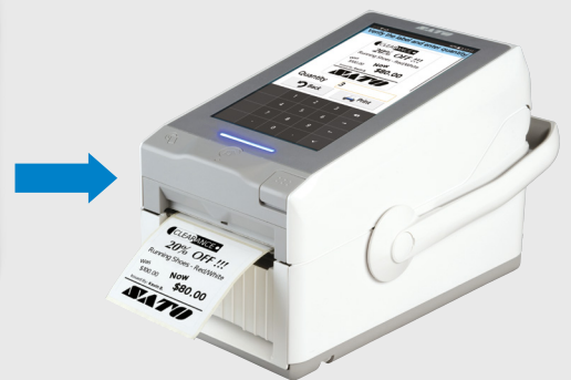
Imprimer les étiquettes

Formats et designs d'étiquettes entièrement personnalisés et calculs automatisés pour réduire les erreurs