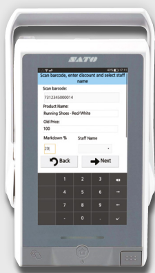
Saisir la réduction