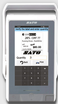
Vérifier l'aperçu et indiquer la quantité