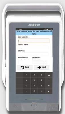
Scanner le code-barres